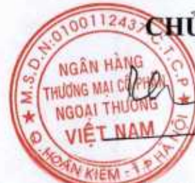
Nghiêm Xuân Thành